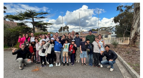
オーストラリアベレア小学校との交流