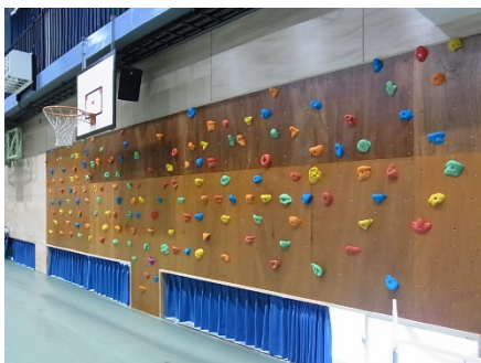
体育館クライミング