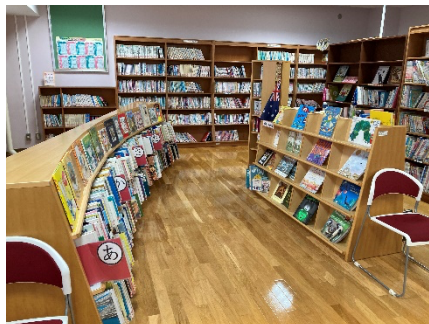
図書館の充実と整備